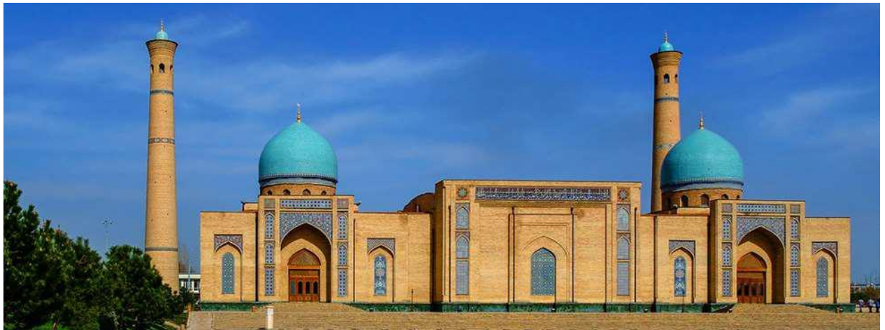
Place Khast-i-Imam 1

Première découverte de la capitale ouzbèke avec la place Khast-i-Imam, centre religieux de Tashkent. L'ensemble architectural est constitué de plusieurs bâtiments ; la madrasa et le mausolée Barak Khan, où se trouve aujourd'hui le centre spirituel des musulmans d'Asie centrale avec le moufti, le mausolée d'al-Kaffal Shashi, la mosquée du Vendredi et la madrasa Moyie Mubarek qui abrite un ancien coran du VIIème siècle.