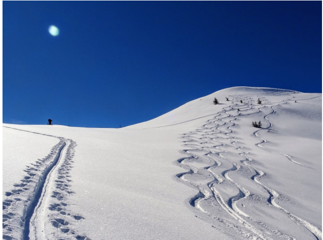
Conditions de rêve au Walighürli

Nous avons dû souvent changer de but de course pour s'adapter aux conditions de neige. Mais l'enneigement de cette saison a été bon, et les conditions météo lors de nos sorties, également, voir nos photos sur Coup d'oeil.