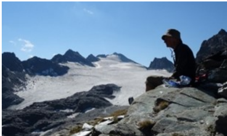
Vue sur la Rosa Blanche depuis le col de Praffleuri

Le Tour des Muverans en 4 jours a remplacé la « clubistique » cette année. Les 11 participants ont découvert toute une série de buvettes d'alpages, mais surtout des paysages magnifiques et sauvages non loin de chez nous, avec certainement comme point fort la traversée des vires des Dents de Morcles avec des vues à couper le souffle.