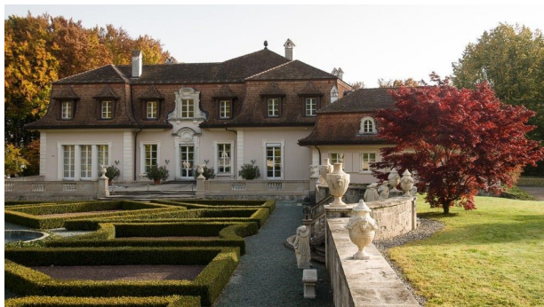
Riggisberg & la Fondation Abegg