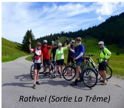
Rathvel (Sortie La Trême)