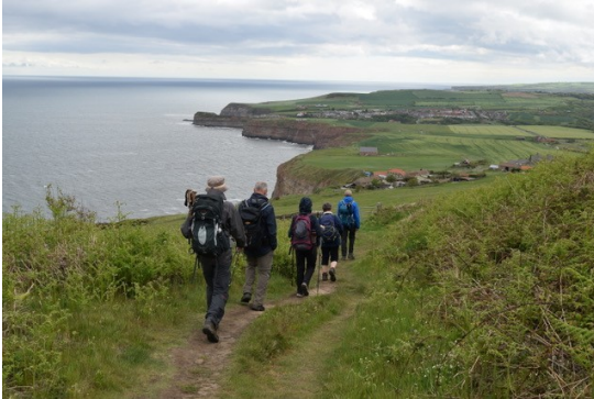
Semaine pédestre Whitby, North York Moors National Park

La saison a été couronnée par la semaine pédestre à Whitby, dans le North York Moors National Park et par le séjour de 3 jours dans L'Oberland bernois.