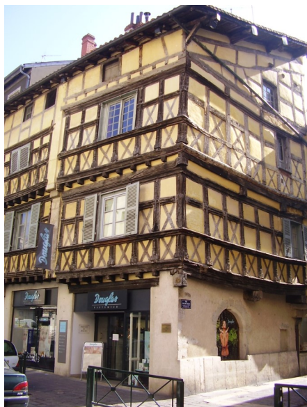
Maison de Bois, Bourg-en-Bresse