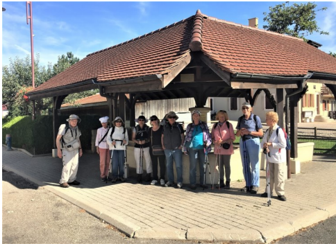
Le Chemin des Fontaines

A noter que dès 2019, les sorties qui ne peuvent pas se faire à la date indiquée pour raison de météo défavorable ou autre, ne sont plus renvoyées au vendredi suivant, comme cela a été le cas jusqu'à l'an de grâce 2018, mais simplement annulées pour l'année en cours. Cette décision a été prise pour éviter aux organisateurs de devoir "bloquer" deux vendredis de suite pour chaque promenade.