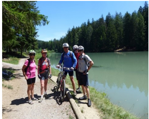
Montagne du Château (sortie Traversée du Jorat)