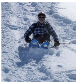
Une manière originale pour la descente