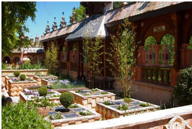
Les jardins secrets de Vault