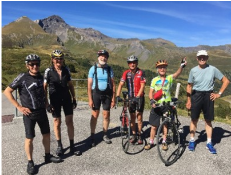
Sommet de la Grosse Scheidegg

Malgré un programme raccourci, les Cyclobaladeurs ont parcouru un total d'environ 1000 km en 14 courses des vendredis, et avec la semaine de Cyclobalades qui se tenait cette année sur l'île de Majorque. Quelques modifications du programme ont dû être faites pour raisons de santé concernant Dirk, l'un de nos chefs de course. Deux bonnes nouvelles au final : Dirk est rétabli, et les solutions ont été trouvées pour remplacer ses courses.