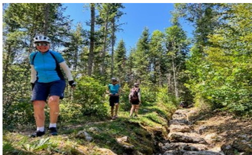
Voie romaine près de Ballaigues

Statistiquement aussi, la saison a été un succès avec 87 participations aux sorties du vendredi, soit une moyenne de 8 participants effectuant 56 km par course. Avec la semaine « Loire », les distances parcourues lors de nos sorties représentent plus de 1200 km.