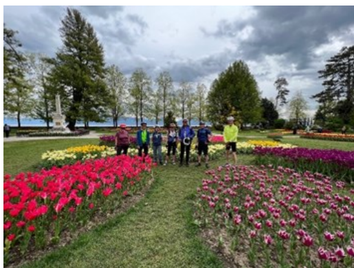
Pont Cérard - Morges, arrivée à Morges