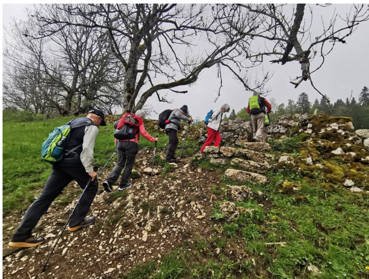
Le Pont - Dent du Vaulion