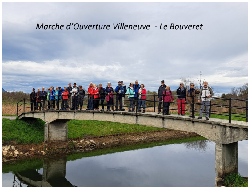
Marche d'Ouverture Villeneuve - Le Bouveret

Nous avons commencé la nouvelle saison début avril comme planifié. Plusieurs marches en avril et mai ont attiré plus de 20 participants. Par exemple Romont - Lucens (23), Apples - Bière (21), Le Pont - Dent du Vaulion (21). La météo a été favorable au début de saison. Fin mai nous avons remplacé Bonnavau par le Creux du Van pour cause de neige à Bonnavau. Fin juin nous avons eu la première semaine pédestre aux Dolomites. 26 participants ont été contents de découvrir cette région spectaculaire. Hôtel à Cortina d'Ampezzo. Des marches très variées pendant la semaine avec le dernière jour spectaculaire à Tre Cime.