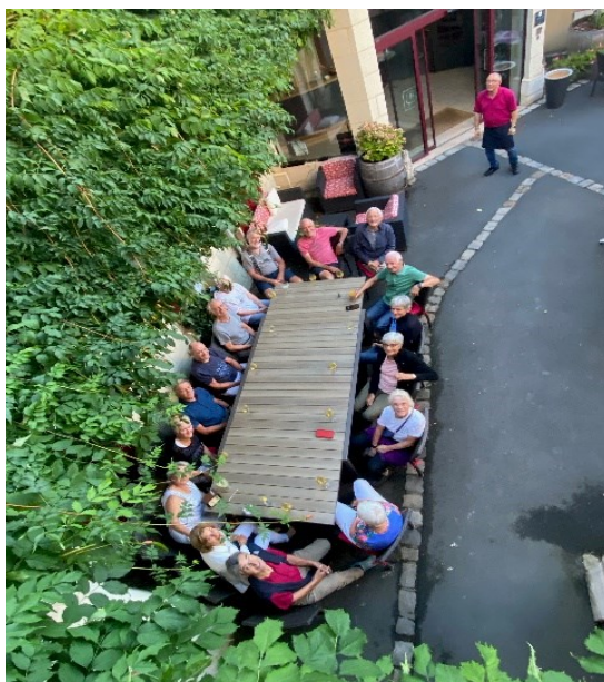
Loire, séjour à Fontevraud

Et d'autres ont pratiqué plus intensément leur sport favori dans un superbe environnement.