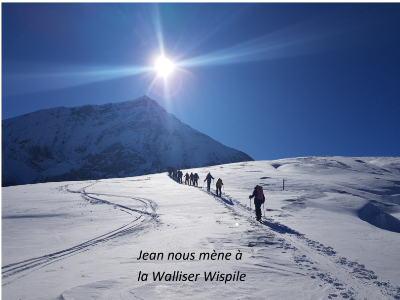
Jean nous mène à la Walliser Wispile

Voir les photos de chaque sortie depuis https://arninfo.ch/activity/randonnees-a-ski/ , Archives, 2023, cliquer Info> pour les courses ayant le sigle Coup d'œil, puis sur PHOTOS en bas de page.