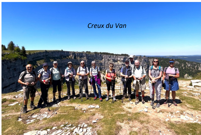
Creux du Van