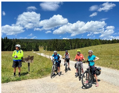
Le Risoux versant suisse