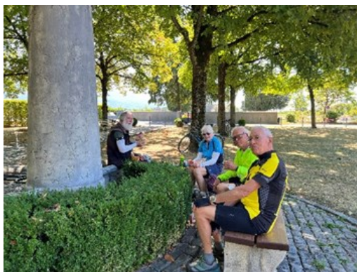
Pays de Jussy