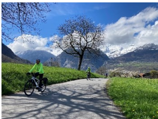
Les Hauts de Bex

Mais en même temps, le nombre de ces courses a été réduit si on le compare aux années précédentes. La raison en a été une météo particulièrement pluvieuse en avril et en octobre-novembre, obligeant les chefs de course à de nombreuses annulations dans ces périodes.